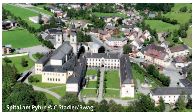
Spital am Pyhrn