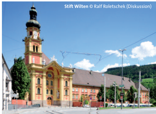
Stift Wilten