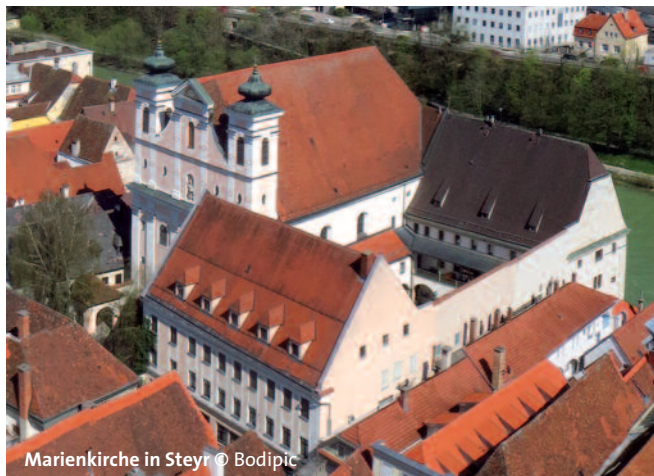
Marienkirche in Steyr