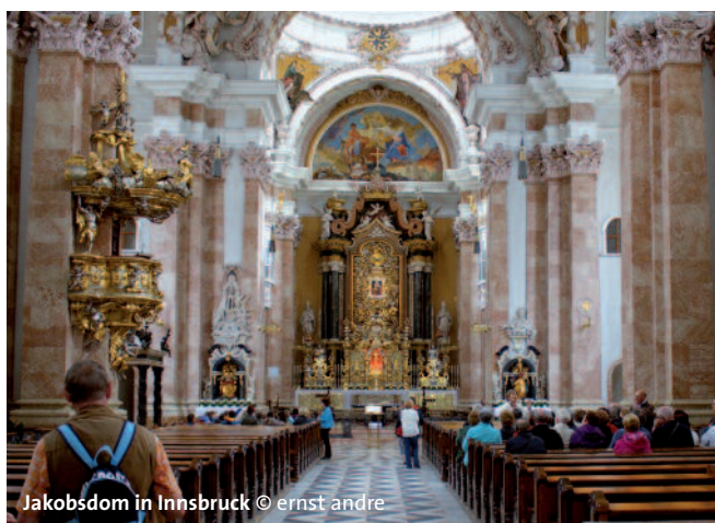
Jakobsdom in Innsbruck

Bewirtung (Frühstück und kleines Abendessen im Zug) nicht inkludiert. Kapellenwaggon im Zug