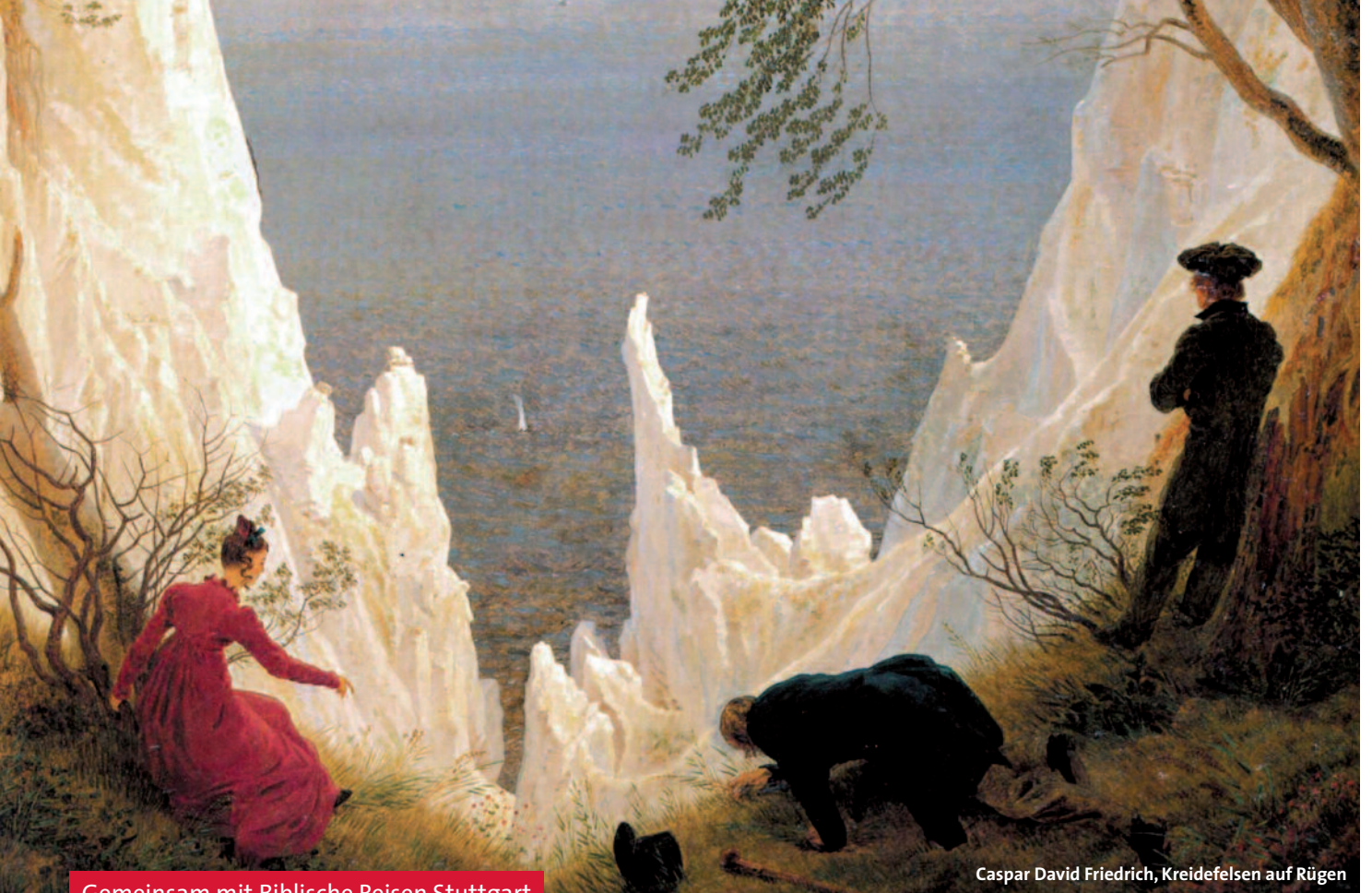
Caspar David Friedrich, Kreidefelsen auf Rügen

Gemeinsam mit Biblische Reisen Stuttgart